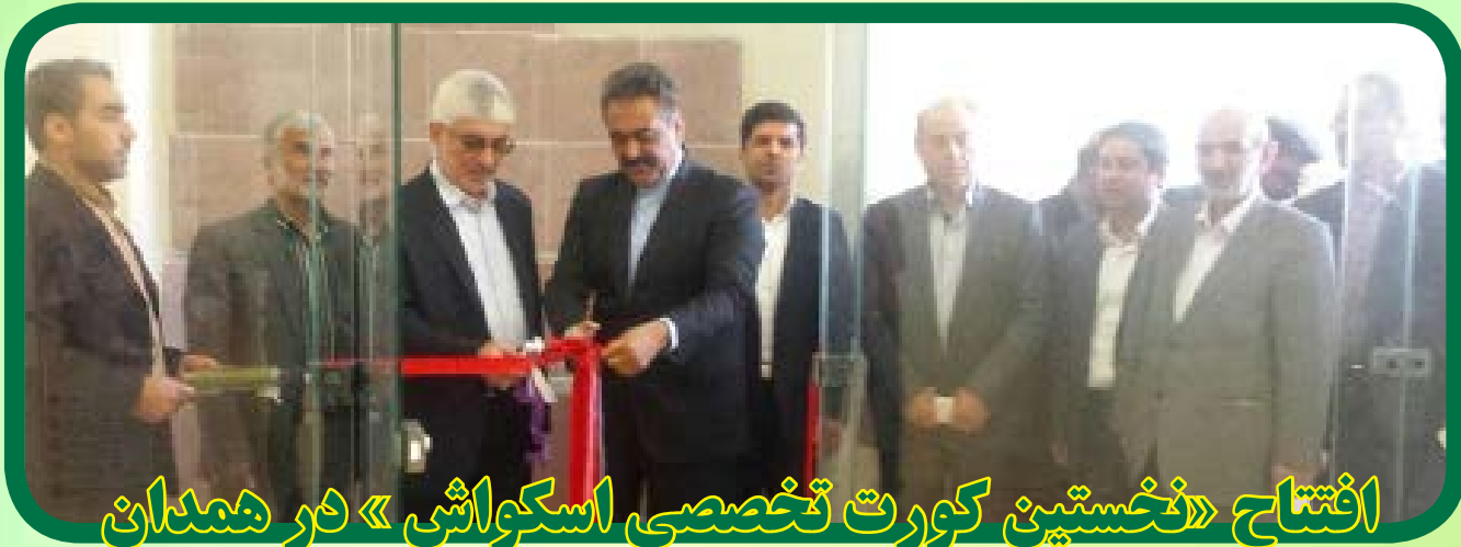
افتتاح «نخستین کورت تخصصی اسکواش» در همدان