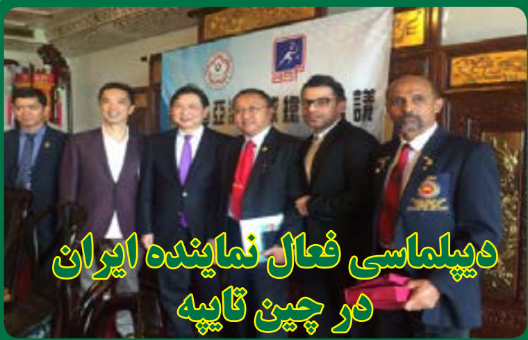
دیپلماسی فعال نماینده ایران در چین تاپه

ماهنامه کورت / نسخه شماره ۱۹ / اردیبهشت ۹۵