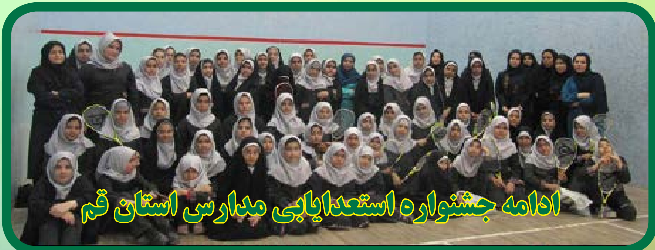
ادامه جشنواره استعدادیابی مدارس استان قم