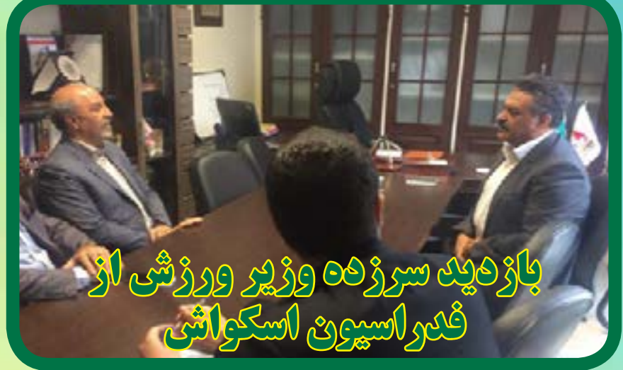
بازدید سرزده وزیر ورزشی از فدراسیون اسکواش